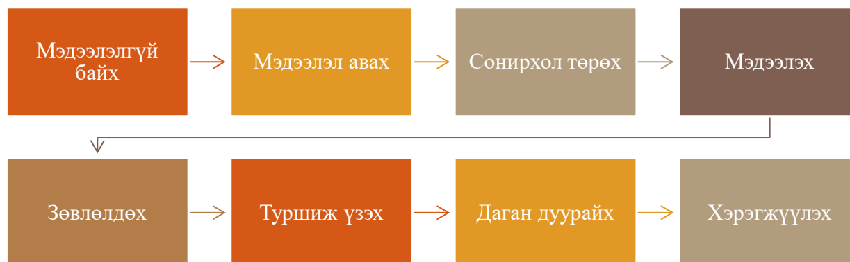
Зураг 2. Хүний танин мэдэхүйн үйл явц

Авилгатай тэмцэх соён гэгээрүүлэх ажлын хувьд авлигыг үл тэвчих ёс суртахууныг төлөвшүүлэх, уг ажиллагаанд тэднийг татан оролцуулах үйл ажиллагааг эцсийн үр дүн гэж харж болох ба үүний тулд оролцоог хангах урьдач нөхцлийг бүрдүүлэх буюу Авлигын талаар ойлголт, мэдээлэл өгөхөөс эхлэх учиртай. Мэдээлэлтэй иргэд зөв хандлага төлвөших, оролцох сэдэл төрөх зэргээр асуудлыг шийдэхэд хувь нэмрээ оруулах боломж бүрдэнэ.