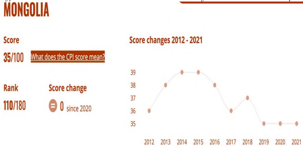
Зураг 1. Монгол Улсын авлигын төсөөллийн индексийн дундаж (2021 оны байдлаар)